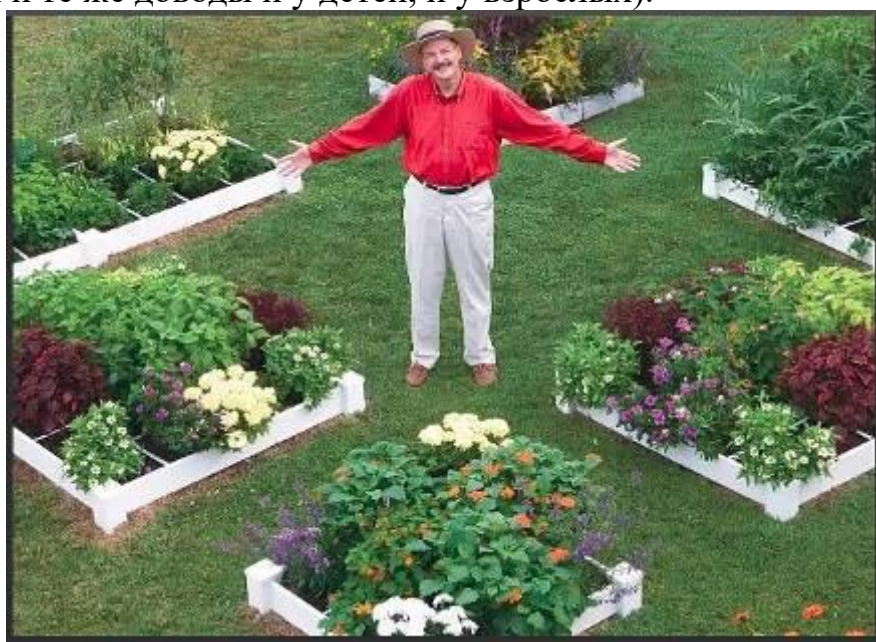
Рис. 1. «Сад квадратного фута» (шахматные грядки; из книги М. Бартоломью).

Этот «огород» (в английском нет для этого слова специального термина), являющийся одним из вариантов приподнятых грядок, придумал около 30 лет назад садоводом Мелом Бартоломью. Организовав программу обучения огородничеству, он столкнулся с быстрой потерей энтузиазма у её участников. Из 100 начавших работать через несколько месяцев осталось только 20 человек (6). Остальные отказались, ссылаясь на занятость, усталость и т.д. (одни и те же доводы и у детей, и у взрослых).