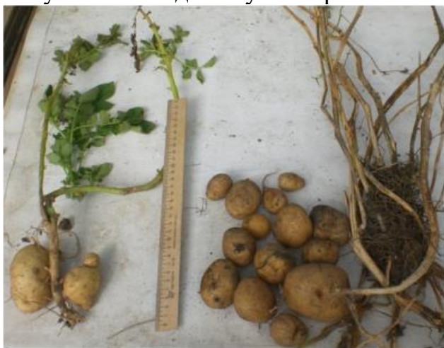
Рис. 6. А вот урожай с этих участков: слева – клубни растений в земле, справа – клубни растений из сена.

Лучший температурный режим под слоем сена в летнее время позволяет получить с каждого куста втрое больше клубней.