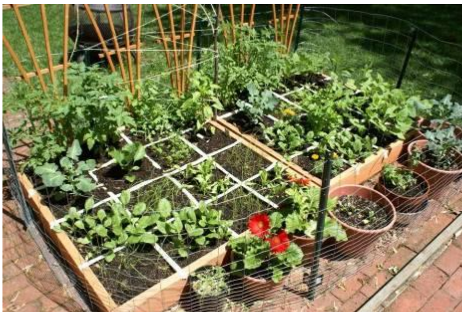
Рис. 2. Расположение культур на шахматных грядках по высоте растений.

На таком огороде сначала сажают самые низкорослые, потом – средне-рослые и только потом - высокорослые растения. Вьющиеся или стелющиеся растения для экономии места направляют на вертикальные опоры (рис. 2). Растения сажают так, чтобы они не затеняли друг друга. Конечно, с одной клетки такого поля не соберёшь большого урожая. Но автор метода считал, что их может быть столько, сколько потребует садоводу, чтобы получить необходимое количество продукции.