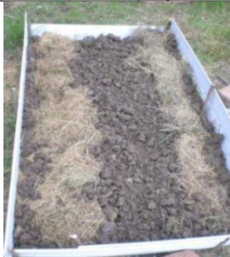
Рис. 3. Делянка сразу после посадки