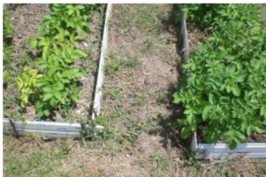
Рис. 4. Вот так выглядели через месяц (в конце июня) после посадки в мае 2015 года растения, высаженные в землю (слева) и в сено (справа).

3. Закрыть клубни слоем растительного материала (трава, сено, солома, листья). Рекомендуемая толщина слоя – 20-30 см.