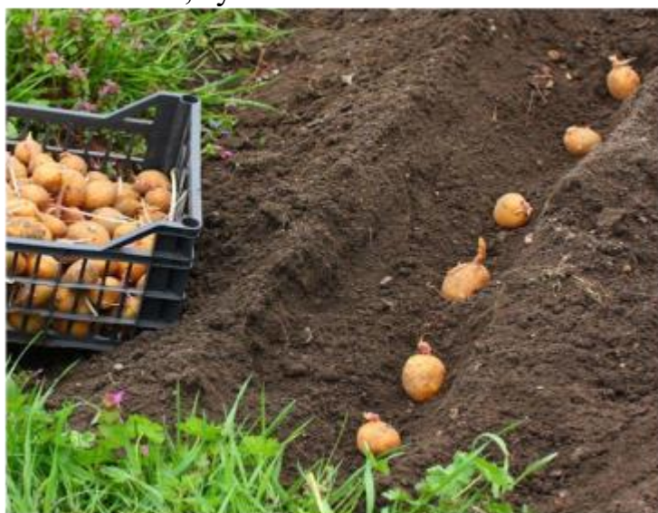
Рис. 1. Посадка картофеля в траншеи

Правда, этот способ выращивания разрабатывали для песчаных почв и на наших тяжёлых, суглинистых и глинистых почвах он неэффективен.