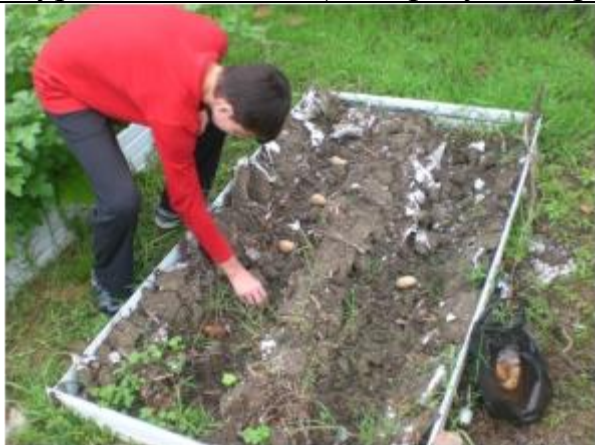
Рис. 2. Посадка клубней

1. Разместить на поверхности земли или – лучше - в неглубокой (до 10 см) траншее (для лучшей сохранности влаги и предохранения от высокой температуры в течение дня) на требуемом расстоянии (25-35 см) клубни,