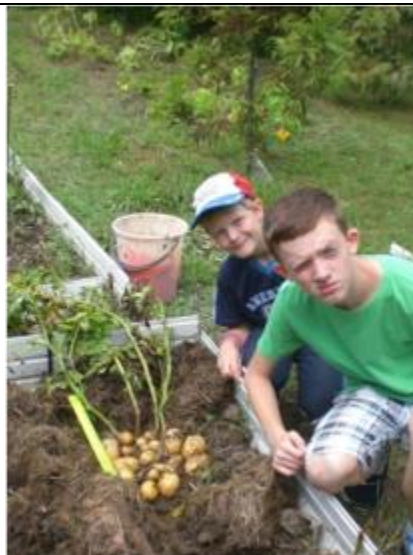
Рис. 5. Сбор урожая.